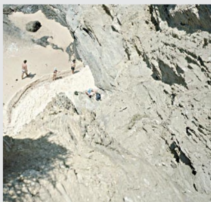
Avant Piquinia, 2008