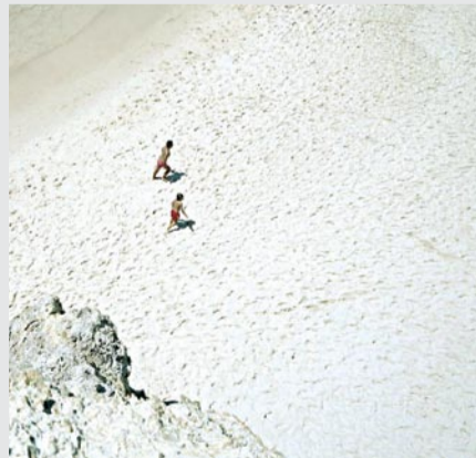
Cotê Grande 3, 2008