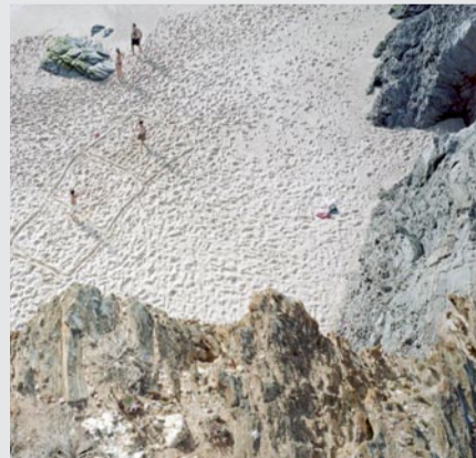
Apres Piquinia, 2008