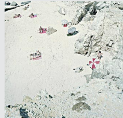
Piquinia Bis, 2008