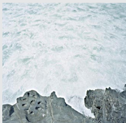
Avant Grande 2, 2008