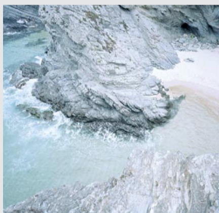
Avant Grande 1, 2008

Fotógrafo que acumula trabalhos pessoais e encomendas publicitárias de marcas internacionais.