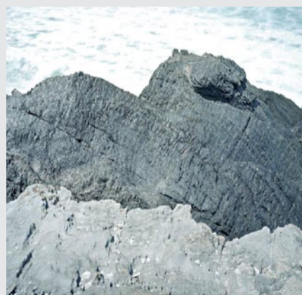
Avant Grande 3, 2008